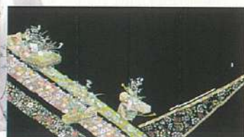
←加賀友禅黒留袖表地