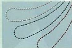
グッドハーツ ネックレス

私たちの身体の周波数は、体中の情報を瞬時に脳に伝え、脳はその情報を瞬時に分析し、最適な対応策を全身に送り返します。主要な周波数は 2030 種類もあり、それぞれが乱れずに流れる事で情報がスムーズに伝わり、身体が本来の持つ力が発揮されます。