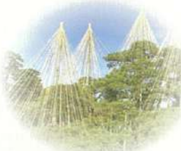
←加賀友禅訪問着表地