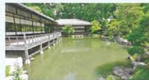
滴翠軒 (ていすいけん)

印月池に架かる2つの橋。「侵雪橋(しんせつぎょう)」は反り橋である一方、「回棹廊(かいどうろう)」は檜皮葺の屋根を持つ橋です。