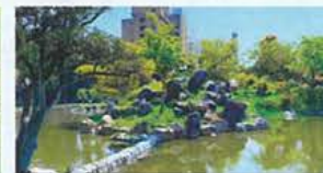
臥龍堂 (がりゅうどう)

池に面して建てられた建築物。緑やかな屋根が軒を差し出し、緑葉が池中に垂り出しているのが特徴です。