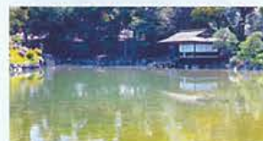
漱枕居 (そうちんきよ)

印月池の6分の1を占める大きな池。東山から上る月影が水面に美しく映ることから、この名が付けられました。