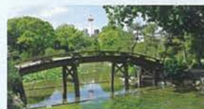
印月池 (いんげつち)

園内には、江戸時代の歴史家「頼山陽」によって「涉成園十三景」と名付けられた美しい建物や風景が存在します。一部ご紹介致します。