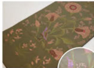
本袋帯 「金更紗花鳥文」