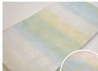
総金綴錦帯 「名物聚楽花兎文」