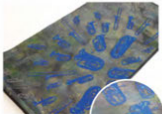
本袋帯 「宇宙のシンフォニー」

尾張徳川家に伝来し、名古屋の徳川美術館に収蔵されている約560件に上る「裂地」は中国の明時代を中心とした染織品で、世界的にも貴重な文化財です。染織品に金を施し、絢爛豪華に見せることは古来より行われていました。光輝く金の箔がやわらかな絹糸をつつみ、機にのせられて鮮やかな黄金の布となるその昔、はるかシルクロードの香りをのせてジバングへ名物裂として誇り高き武将の眼にとまる幻の総金は四百有余年の歳月を経て今よみがえる。