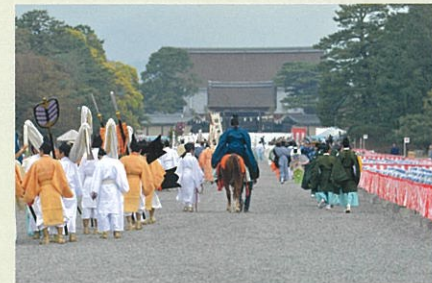
※10月22日が雨天の場合、神幸祭以下行事が順延となります。

維新勤王隊の奏する笛や太鼓の音色を先頭に、約2,000名・約2キロにわたる行列は順次、明治維新時代から平安京の造営された延暦時代にさかのぼり、歴史と伝統の都・京都三大祭の一つとして、京都の秋を代表する祭りとなっています。