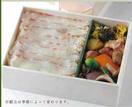
※献立は季節によって変わります。