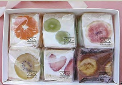
※フルーツは自産のもののみ。 お真と価格が10%の値上げの可能性があります。